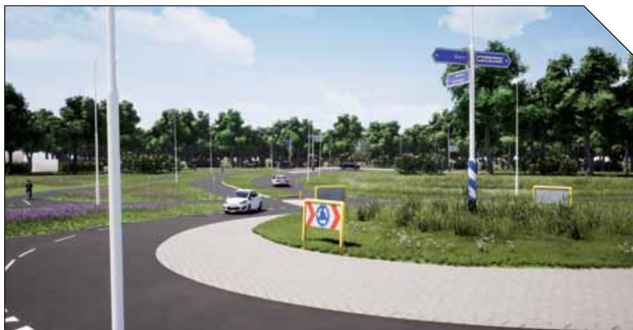
Visualisatie van een nieuwe rotonde, gemaakt door 2j3D.

Een veelgehoord argument onder zpp'ers die niet alleen ontwerpen is dat zij de NLCS – en de bijbehorende software – niet dagelijks nodig hebben. Zonde van de tijd en energie, zo redeneren zij. Out denkt precies andersom: "Júist als je er niet dagelijks mee werkt, profiteer je van die uniformiteit."