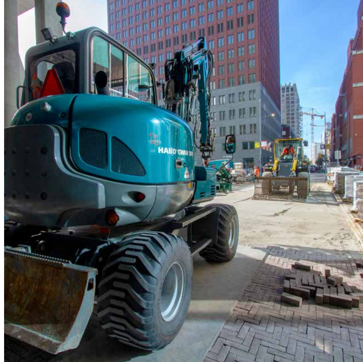
Machinaal aanbrengen van bestrating aan de Haagse Loper in Den Haag.

Bijkomend voordeel van werken met een uniforme standaard is de overdraagbaarheid. Remmerswaal: “Onze tekenaars werken vooral aan hun eigen projecten, maar het komt wel degelijk voor dat ze werk overdragen. Stel dat de ene collega een tekening opstelt en een andere de revisie uitvoert. Die kan zo verder werken, zonder zich extreem in de tekening te hoeven verdiepen. Overigens zie ik altijd een directe link tussen de NLCS en InfraCAD, de AutoCAD plugin. Sterker nog: zonder InfraCAD is er voor mij geen NLCS. InfraCAD heeft veel voordelen en werkt heel intuïtief. Natuurlijk, in het begin kost het tijd om het te leren. Ook wij hadden het idee dat er in korte tijd veel op ons af kwam. Maar als je je er even in verdiept, leer je al snel heel veel.”